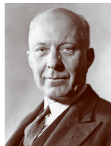
Џу Далтон, шеф Управе за специјалне операције (SOE)

Незадовољство српског језгра војске било је нарочито изражено након постизања споразума о бановини Хрватској и формирања Владе Цветковић–Мачек. Армијски врх није могао да опрости кнезу Павлу тај потез, јер је, по мишљењу високих војних кругова, тиме значајно опала и одбрамбена моћ земље. На то се надовезала и чињеница да је од избијања Другог светског рата Краљевина Југославија постала центар стране пропаганде, док је Београд био централа целокупне иностране пропаганде на Балкану. Наиме, од почетка рата до пада Француске у пропагандном раду на територији Краљевине Југославије на првом месту стајали су Немци, који су потрошили око 3.000.000 динара, од чега је 2.000.000 утрошено на немачку мањину. После Немаца били су Енглези, са око 2.000.000, док су Французи дали око 1.800.000 динара. Енглези и Французи су новац усмераваали искључиво на југословенско јавно мњење. Очигледно је да је количина новца који су Енглези и Французи улагали у пропаганду у Југославији усмерену на припаднике југословенских народа била готово четири пута већа од немачке. Након пада Француске у јуну 1940. пропагандни, али и агентурни рад обеју зараћених страна још се више појачао. Британска Управа за специјалне операције (SOE) стварала је од лета 1940. своје упориште углавном у Србији, играјући на карту савезништва са Србима из Великог рата и на новац. Њени агенти везали су за себе већи број виђенијих људи у националним удружењима, Зе-