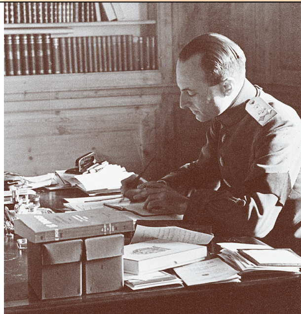
Кнез Павле Карађорђевић у радном кабинету

Свакако један од узрока који су инспирисали преврат био је и хрватско-српски спор око преуређења Југославије, који се захуктао баш након оснивања „Конспирације”. На-