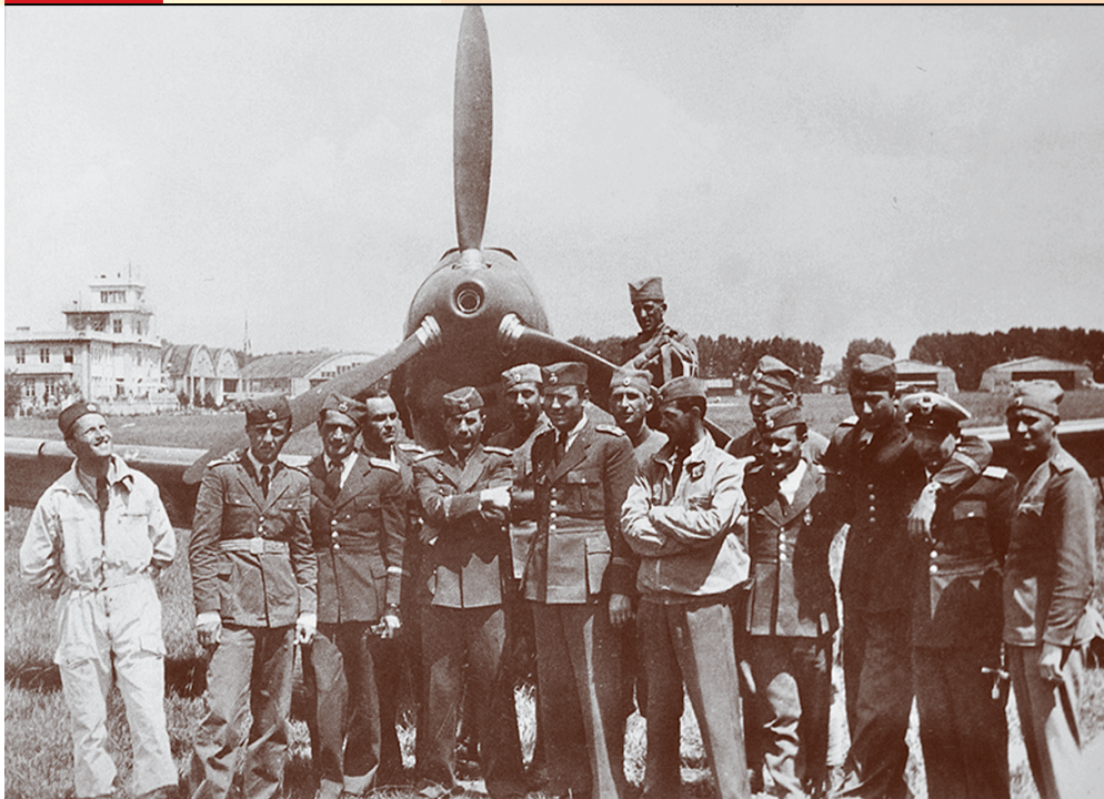
Пилоти 6. ловачког пука ЈРВ

мљорадничкој и Самосталној демократској странци. Према процени њеног шефа Хјуа Далтона, општи трошкови британске круне у Југославији за стварање погодне климе уочи пуча од 27. марта 1941. износили су више од 100.000 британских фунти или 17.650.000 ондашњих динара, што је било око девет пута више од новца који је Британија уложила у пропагандне сврхе у Југославији од почетка рата до средине 1940. године.