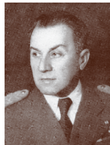
Генерал Боривоје Мирковић