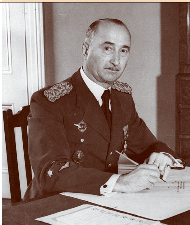
Генерал Душан Симовић

Британска агентура припремала је превентивно терен за пуч и кроз контакте са провереним људима из југословенске војске који би могли бити од користи приликом његовог спровођења. Тако је шефу „М-одсека” – тајног сервиса југословенске војне обавештајне