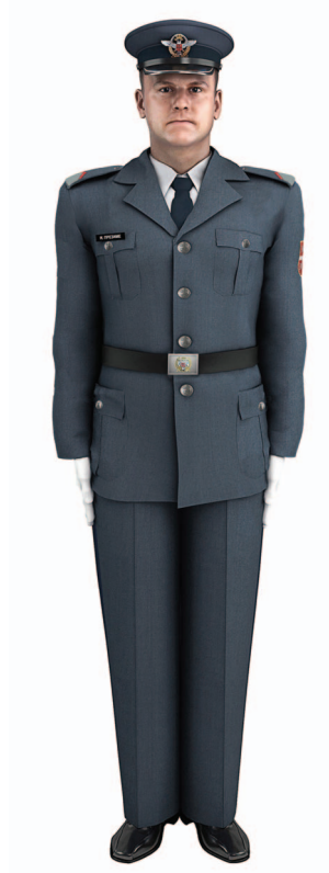
Слика 18 – Свечана униформа ученика Средње стручне војне школе вида РВиПВО