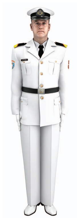
Слика 16 – Свечана униформа кадета Војне академије рода РЈ