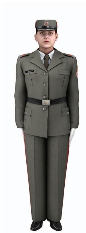
Слика 17 – Свечана униформа ученика Средње стручне војне школе вид КоВ

После Сlike 16 – Свечана униформа кадета Војне академије рода РЈ, додају се слике 17, 18 и 19: