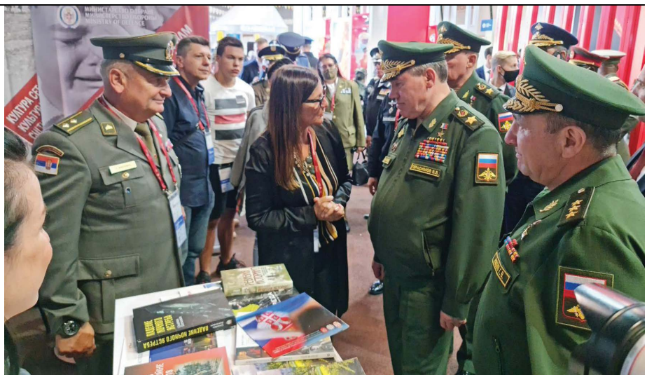
Изложбени штанд Србије у Дому дружбе посетио је начелник Генералштаба Оружаних снага Руске Федерације генерал армије Валериј Герасимов

– Нема места за калкулације. Максимално да се приђе до препреке и што агресивније. Али пазите, саме препреке, поготово најопасни-