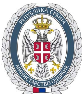
Знак Министарства одбране у боји