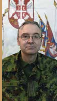
Пуковник Лазар Остојић