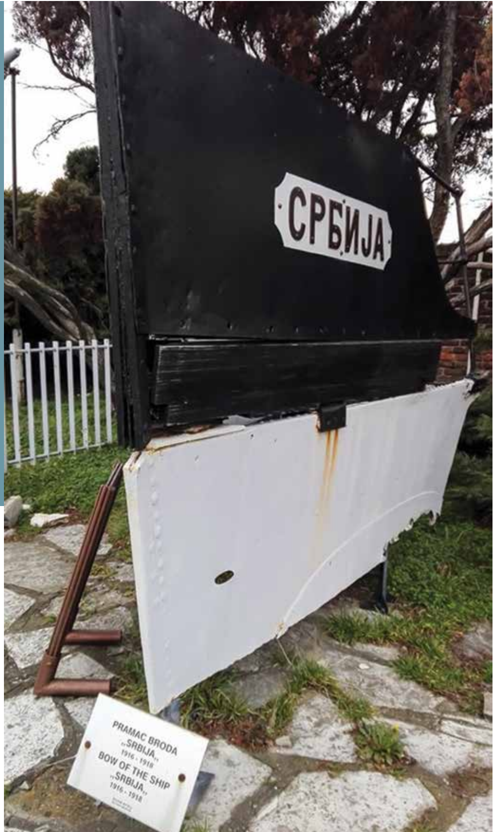
Прамац брода „Србија“, Војни музеј