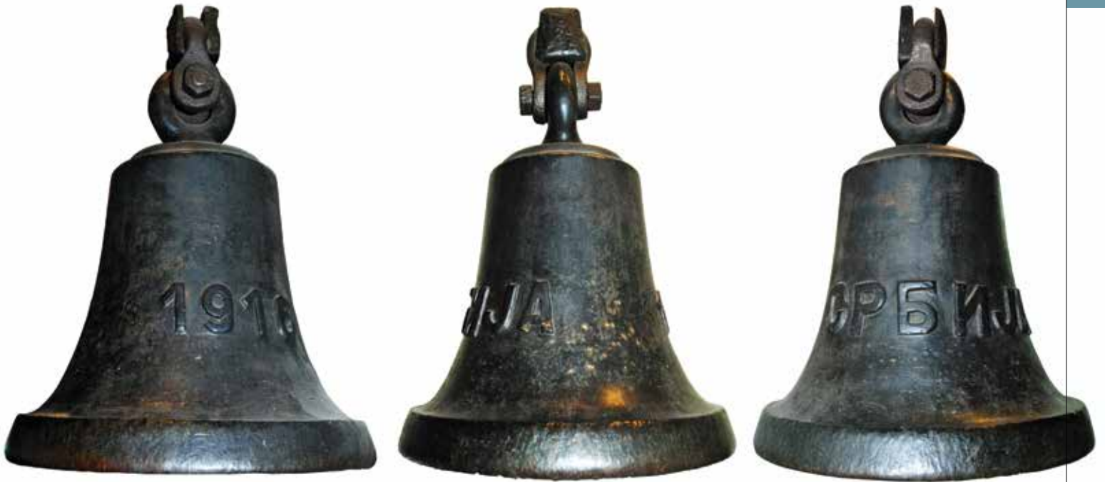
Звоно са торпиљера "Србија". Војни музеј, Београд (ВМБ)

ту да се задржава и када да полази из Микре за Солун. Захтев шефа Саобраћајног одељења био је да распоред вожње буде сличан оном на Крфу, имајући у виду потребе официра и војника који долазе и одлазе из Солуна. Сматрао је да би било најбоље да брод из Солуна пре подне полази између 6 и 7 сати, а по подне између 3 и 4 сата. Из Микре је требало да полази око 8 сати ујутру и око 4 по подне, што је одговарало времену када официри и војници треба да стигну у Микру, као и времену када се враћају у Солун. Команданту Бродарске команде дат је задатак да припреми све што је потребно да брод може да пристане на одређено место у Микри и Солуну.