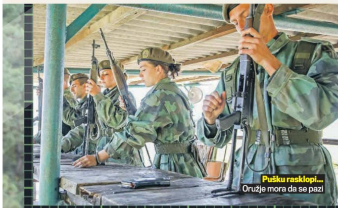
Pušku rasklopi... Oružje mora da se pazi

Jutarnja gimnastika nije za šalu. Pre nego što se vojnici pripreme za vežbanje moraju da izglancaju obuču tako da se mogu ogledati u njoj, a gornji deo uniforme mora biti do perfektnosti sklopljen i složen na predviđeno mesto