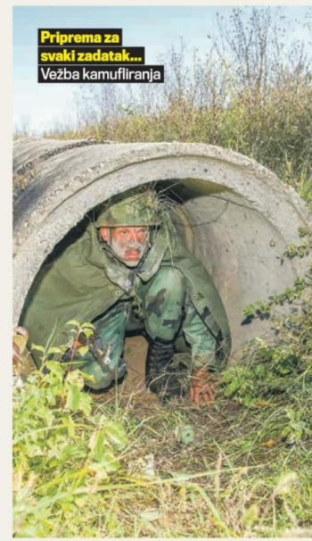
Priprema za svaki zadatak... Vežba kamufliranja

Posle doručka podosmo u logorski prostor. Vozeći se automobilom, primetili smo četu mladih i kompletno opremljenih vojnika koja je promicala ostavljajući za sobom drum,