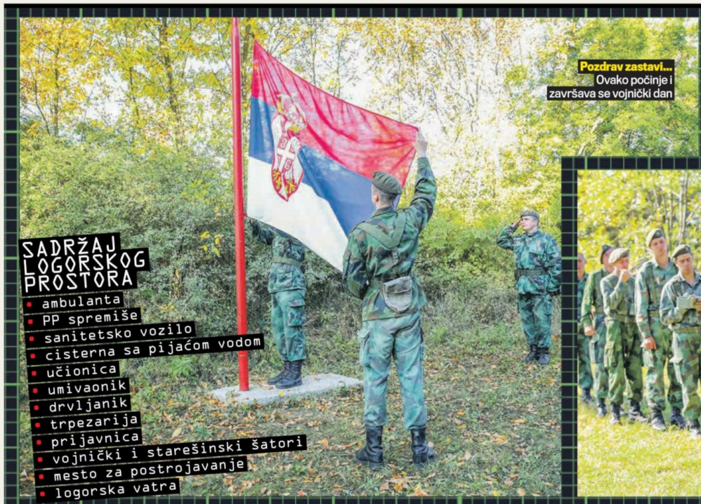
Pozdrav zastavi... Ovakvo počinje i završava se vojnički dan