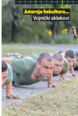
Jutarnja fskultura... Vojnički sklekovi