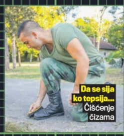
Da se sija ko tepsija... Čišćenje čizama