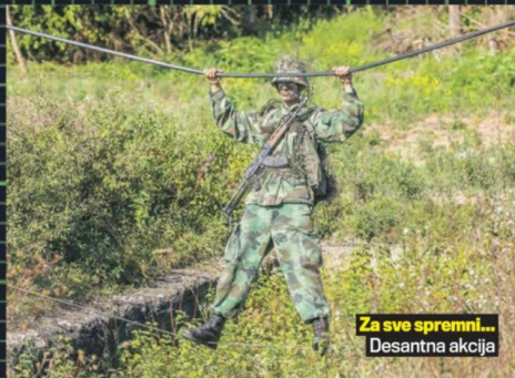
Za sve spremni... Desantna akcija

- Vojniče, kako ti se čini hrana? - upitao sam mladića koji je sede za stolom pored nas. - Ekstra - rekao je kroz osmeh. - Idem i po repete - isceri se i nastavi da jede.