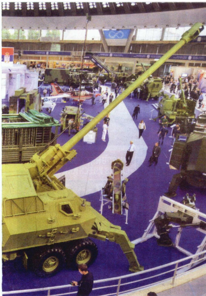
МЦ Одрбрана / Јово Мавула