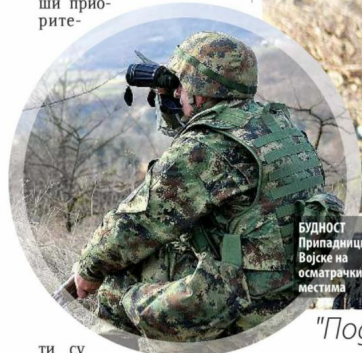
БЕДНОСТ Припадници Војске на осматрачким местима

У КОПНЕНОЈ зони безбедности према северном делу Косова и Метохије коју обезбеђују припадници Друге бригаде Копнене војске Србије (КовВ), стање је редовно, а безбедност на високом нивоу. Војска је гарант безбедности свих грађана Србије без обзира на њихову националну, верску и другу припадност, и њени највиши приоритети-