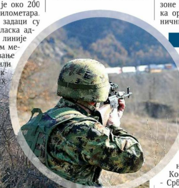
СИГУРНОСТ Комбиноване патроле су "будни" 24 сата

” Зона одговорности базе "Рудница" је око 200 квадратних километара