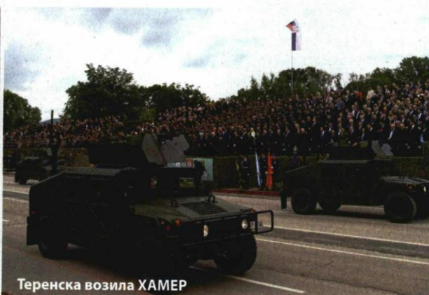
Теренска возила ХАМЕР