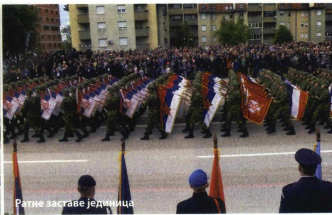
Ратне заставе јединица