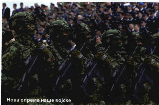
Нова опрема наше војске