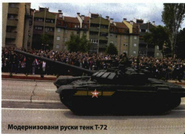
Модернизовани руски тенк Т-72