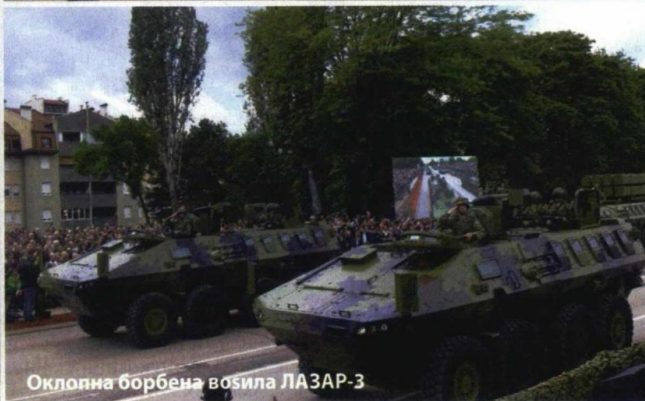
Оклопна борбена возила ЛАЗАР-3

Н азив заједничке активности Војске Србије и полиције наше земље, „Одбрана слободе“, на свој начин говори о циљевима и дOMETИМА овогodiшње параде у Нишу, организоване поводом Дана победе. Том догађају присуствовао је државни и војни врх Републике Србије, али и гости из иностранства.