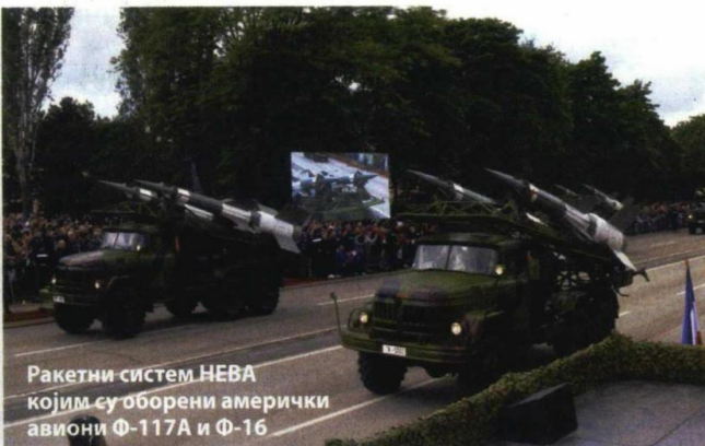
Ракетни систем НЕВА којим су обоорени амерички авиони Ф-117А и Ф-16