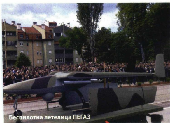
Беспилотна летелица ПЕГАЗ