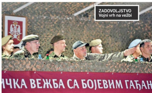
ZADOVOLJSTVO Vojni vrh na vežbi

Učesnici vežbe su se oslanjali na savremene sisteme za osmatranje i gađanje u noćnim uslovima, koji su montirani u oklopna borbena vozila točkaše lazar 3, PASARS, „Pancir S-1“, BRDM-2MS, na tenkovima T-72MS, vozilima pešadije i drugim sredstvima iz razvoja, helikopterima H-145 i mi-35, te bespilotnim vazduhoplovima sn-92 i vrabac. M. J.