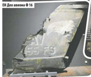
ЕН Део авиона Ф 16

- Током ноћи, када утихну сва светла и сви звучни поставке, једино се то дрво не гаси - каже аутор изложбе. - И порука поставке је да побеђује живот и да поред свега, Србија васкрсава. Битно је за наше друштво да негује сећање, а овакве поставке помажу нам да се решимо наше колективне амнезије. ■