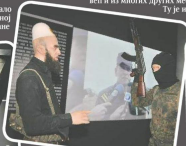
СУКОБ Терористи и српски полицајац