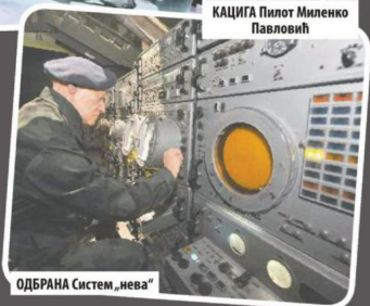
ОДБРАНА Систем „нева“