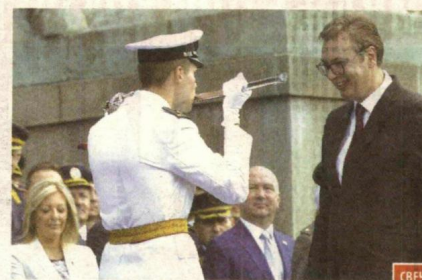
СВЕЧАНО Председник Вучић уручио је најбољим потпорничцима официрске сабље

РАЈУ СВИМА ДА БУДУ ПРИЈАТЕЉИ. Јер водимо рачуна о себи и свом народу. - У условима покушаја ревизије историје и претварања целата у жртву, Србија успешно води европску политику, али и једнако добро сарађује са Русијом, Кином, САД и пре свега чува и води политику мира на Балкану - нагласио је Вучић. - То је постало могуће када смо се, уместо снисходљивог додворавања, окренули себи и свом историјском искуству. Прихватамо да су и други имали жртве, памтимо и осуђујемо почетак агресије 1999. и посебно поштујемо официре који су начувачанском храброшћу на српским Теропилима, Кошарама, зауставили непријатеља. Војна академија је једна од најугледнијих школа за официре у свету, истакао