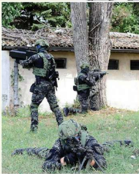
▲ ПРЕЦИЗНИ Обука са пушком за ометање и обарање дрона

че 3.200 метара, ураде одређени број склекова и трбушњака, као и да умеју да пливају и роне. Време за