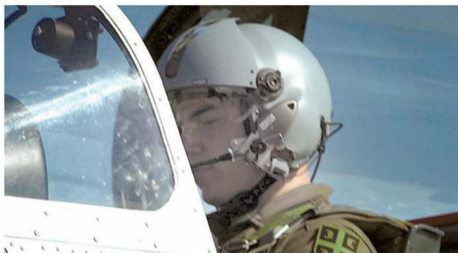
▲ ПОЗИВ Конкурс је отворен до 30. јула

јеру у јединици, они ће имати прилику да на доградње свог знања. У тих шест месеци на Војној академији летеће на авиону "ласта". Имаће налете у склопу основног и акробатског летења, што је први раздео летачке обуке. Када кандидат заврши обуку на првом разделу, биће промовисан у потпоручника Војске Србије.