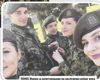
ПОНОС Милан са колегицама на одслужењу војног рока

Први војнички задатак њему и колегама из класе било је опремање хале Сајма у Београду за прихват лакше оболелих па-