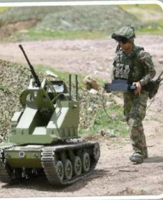
ВЕЖБИ највиша војничка оцена "врло добро"

Он се осврнуо и на осталу војну технику коришће-