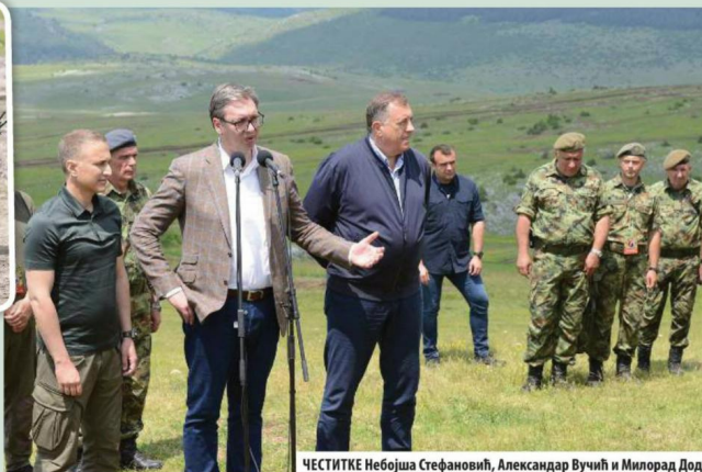
ЧЕСТИТКЕ Небојша Стефановић, Александар Вучић и Милорад Додик