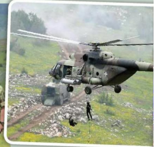
ДИНАМИКУ маневрира дати хеликоптери Ми-35

ну у "Муњевитом удару": - Гледали смо укупно 25 ловачких авиона и бомбардера, а пре неколико година смо имали свега четири-пет. Наши "орлови"