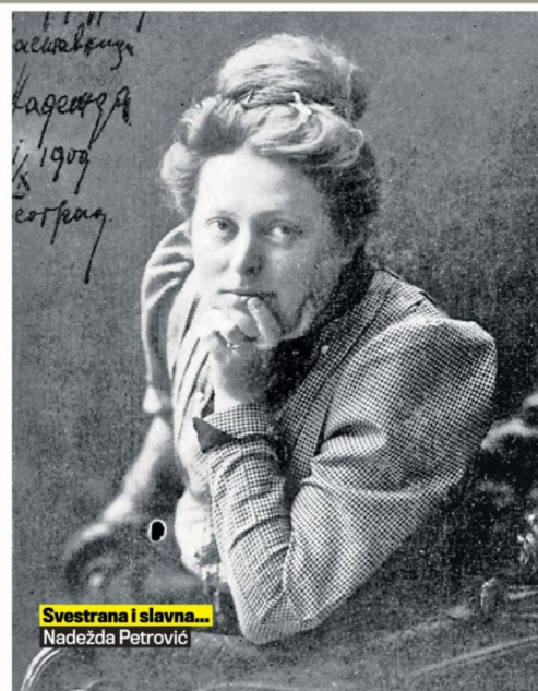
Svestrana i slavna... Nadežda Petrović

Ona je dodala da je Nadežda uvek bila ispred svog vremena i širila duhovne vidike savremenika, živeći baš onako kako je poručivala: „Umetni-