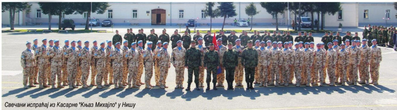
Свечани испраћај из Касарне "Књаз Михајло" у Нишу

У КАСАРНИ "КЊАЗ МИХАИЛО" ЈУЧЕ У МУЛТИНАЦИОНАЛНУ ОПЕРАЦИЈУ НА КИПРУ СВЕЧАНО ИСПРАЋЕН СТРЕЉАЧКИ ВОД