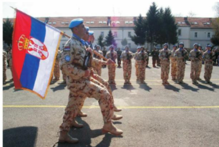
У међународном окружењу бране част Србије и народа