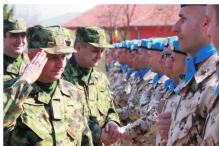
Операција на Кипру значајна за државу и Војску