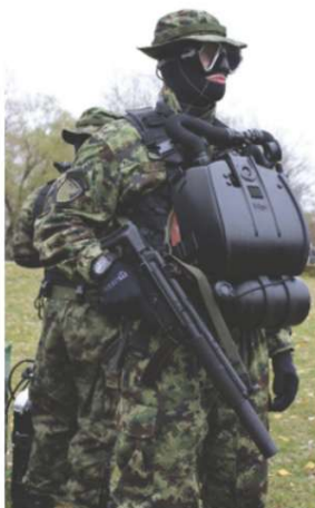
▲ Primer konfiguracije opreme specijaliste ronjenja 72. izviđačko-diverzantskog bataljona

U kategoriji automata (engl. Submachine Gun) u upotrebi su osnovni modeli HK-MP5 kalibra 9×19 mm, od kojih je određen broj proizveden po licenci u bivšoj Jugoslaviji. Ovi automati zastupljeni su u raznim modelima, poput MP5 A2 sa fiksnim kundakom izrađenim od polimera, zatim MP5 A3 sa teleskopskim, kao i prigušeni MP5 SD 3 odnosno skraćeni MP5 K. Uz ove, osnovni modeli iz ove kategorije naoružanja jesu i noviji UMP automati 9×19 mm Parabellum/Luger, za koje nemački proizvođač smatra da bi trebalo da zamene legendarnu seriju MP5, a kao jedan od aduta ističe se i osetno niža cena HK-UMP". Ipak, masivnost bloka zatvarača oružja uzrokuje i znatno jači trzaj pri paljbi, u poređenju s modelima starije serije. Ovi automati najčešće se mogu videti kao deo naoružanja Sokolova te pripadnika 63. padobranskog bataljona. U upotrebi su i modeli Zastava M-85 u 5,56×45 mm NATO i Zastava M-92 u 7,62×39 mm, koje potpisuje nacionalni proizvođač "Zasta-