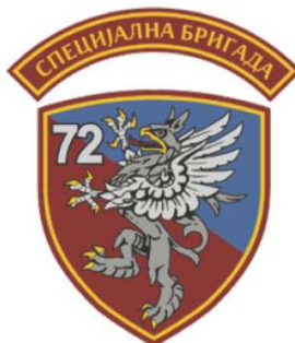
↓ Amblem 72. izviđačko-diverzantskog bataljona

druge strane, viša cena proizvodnje trebalo bi da znači da oprema ove vrste u većoj meri zadovoljava standarde koje postavljaju potencijalni korisnici – specijalci: taktičke, biomehaničke, zaštitne i druge kriterijume.