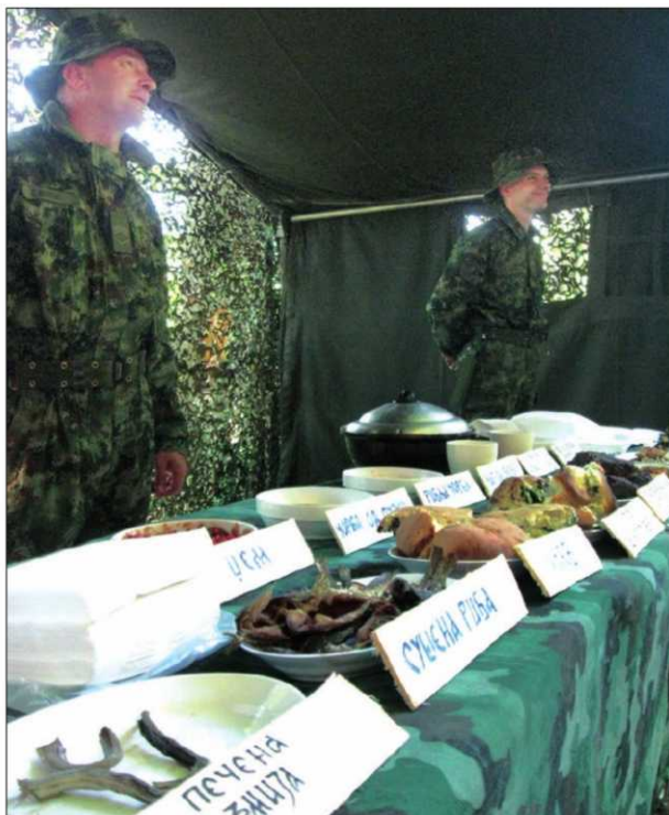
ГОЗБА Богат јеловник специјалаца изложен на столу

На стрминама Стола специјалци вежбају такозвано војничко верање. Тимови војника повезаних конопцима, висе са неколико стотина метара голе и као зид равне стене. Најтежи задатак има вођа групе, чији је задатак да бира најлакши пут, побија клинове у љути камен и тако трасира пут осталим члановима борбене групе.