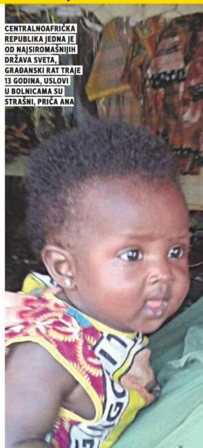
CENTRALNOAFRIČKA REPUBLIKA JEDNA JE OD NAJSIROMAŠNIJIH DRŽAVA SVETA, GRADANSKI RAT TRAJE 13 GODINA, USLOVI U BOLNICAMA SU STRAŠNI, PRIČA ANA