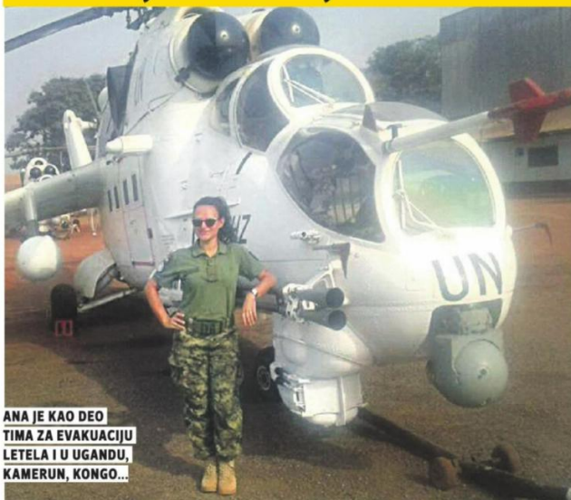
ANA JE KAO DEO TIMA ZA EVAKUACIJU LETELA I U UGANDU, KAMERUN, KONGO...