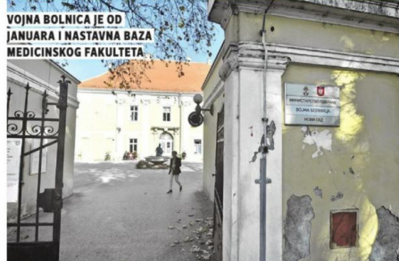
VOJNA BOLNICA JE OD JANUARA I NASTAVNA BAZA MEDICINSKOG FAKULTETA