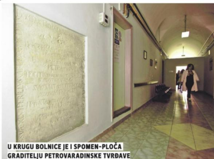
U KRUGU BOLNICE JE I SPOMEN-PLOČA GRADITELJU PETROVARADINSKE TVRĐAVE

Vojna bolnica u Petrovaradinu obeležava svoj 235. rođendan, a taj veliki jubilej svrstava je u najstariju ustanovu tog tipa u Evropi, koja nije prekidala sa radom ni u najtežim ratnim uslovima.