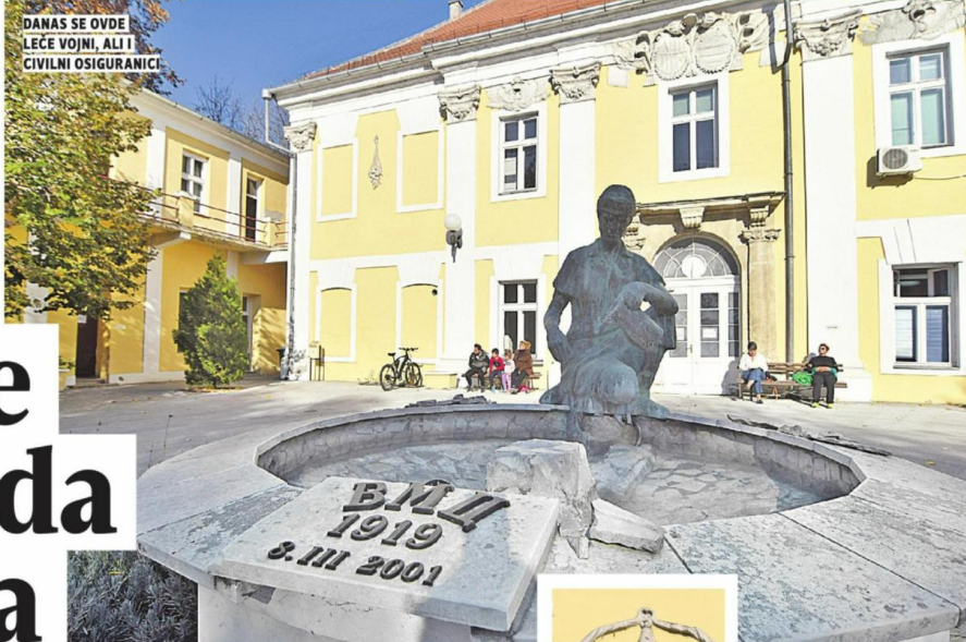
DANAS SE OVDE LEČE VOJNI, ALI I CIVILNI OSIGURANICI