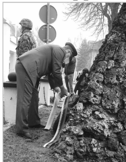
ГОТОВО ВЕК И ПО У СЛУЖБИ НАРОДА И ВОЈСКЕ: Војна болница свечаношћу обележила 143 године постојања

По његовим речима отворена је и ковид амбуланта у комплексу Шивара да би својим осигурањима олакшали приступ за лечење корона вируса, где