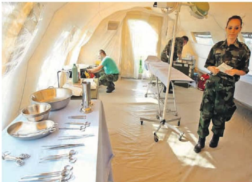
Припадници војске у болници под шаторима

– Овде је могуће обавити једноставније хируршке интервенције, рендген дијагностику, лабораторијске претраге, интернистичке, ортопедске и оста-