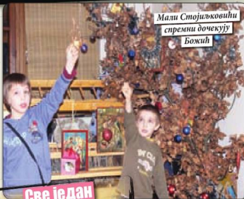
Мали Стојиљковићи спреми дочекују Божих

У domu ове многочлане породице владају савршени ред и